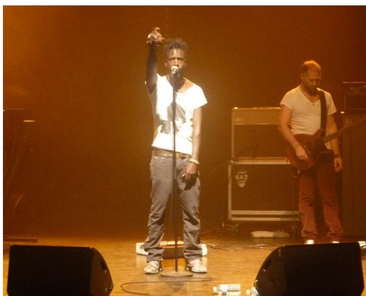
Concert de Saul Williams