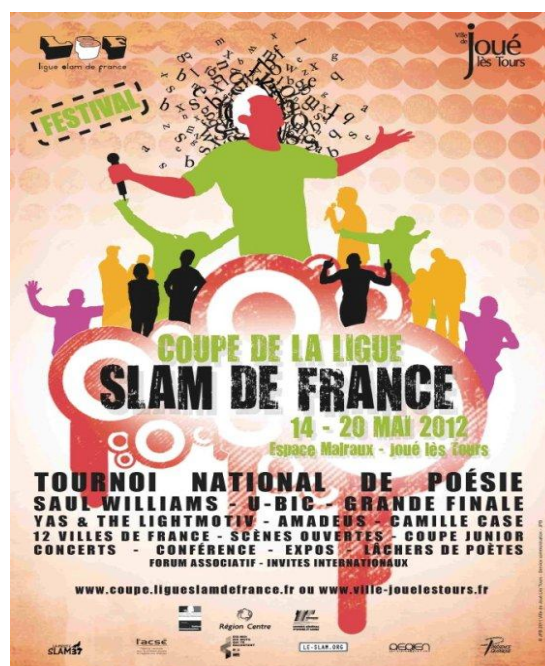
Affiche de la Coupe 2012